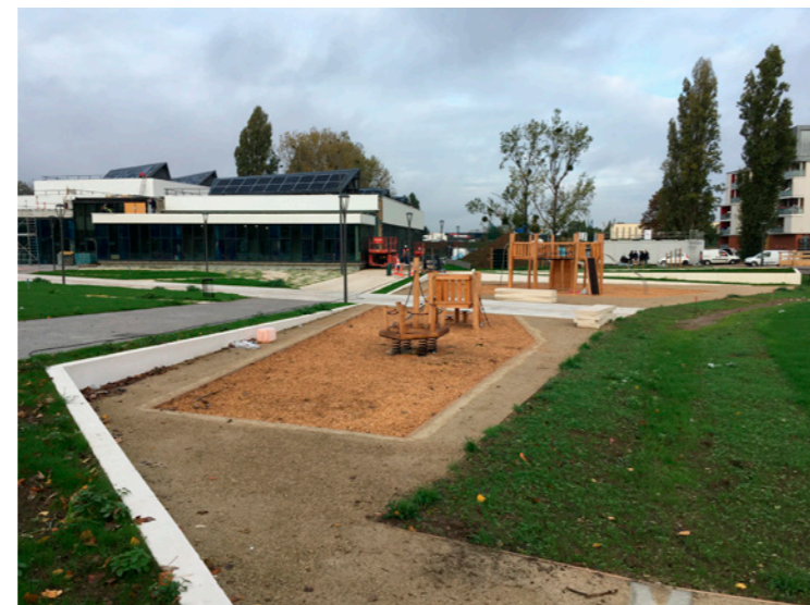
Chantier en cours - Aire de jeux enfants

"Signifier par la gestion des eaux pluviales, la présence de rus enterrés"