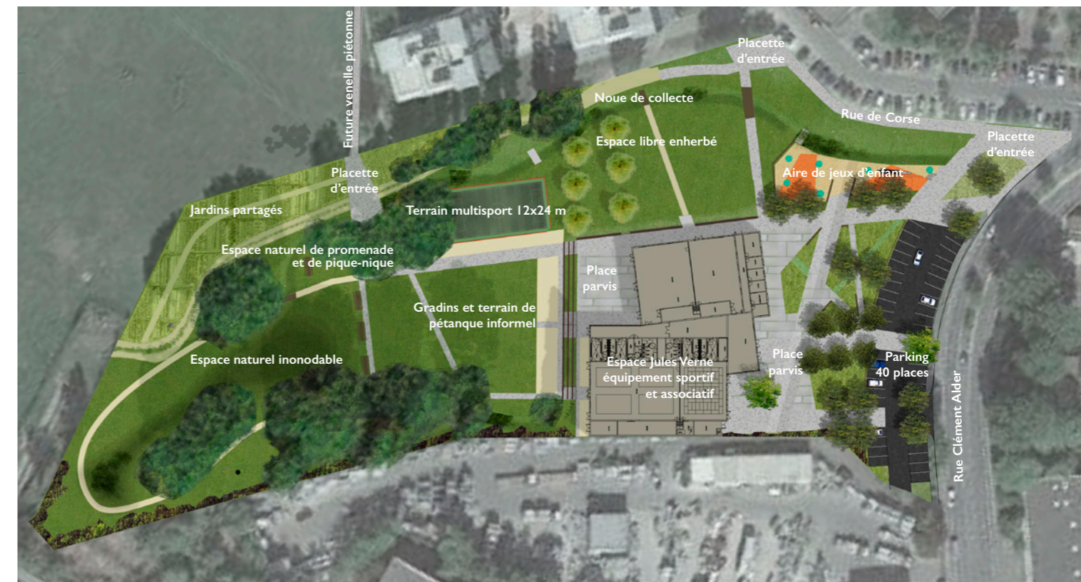
Vue générale du futur parc