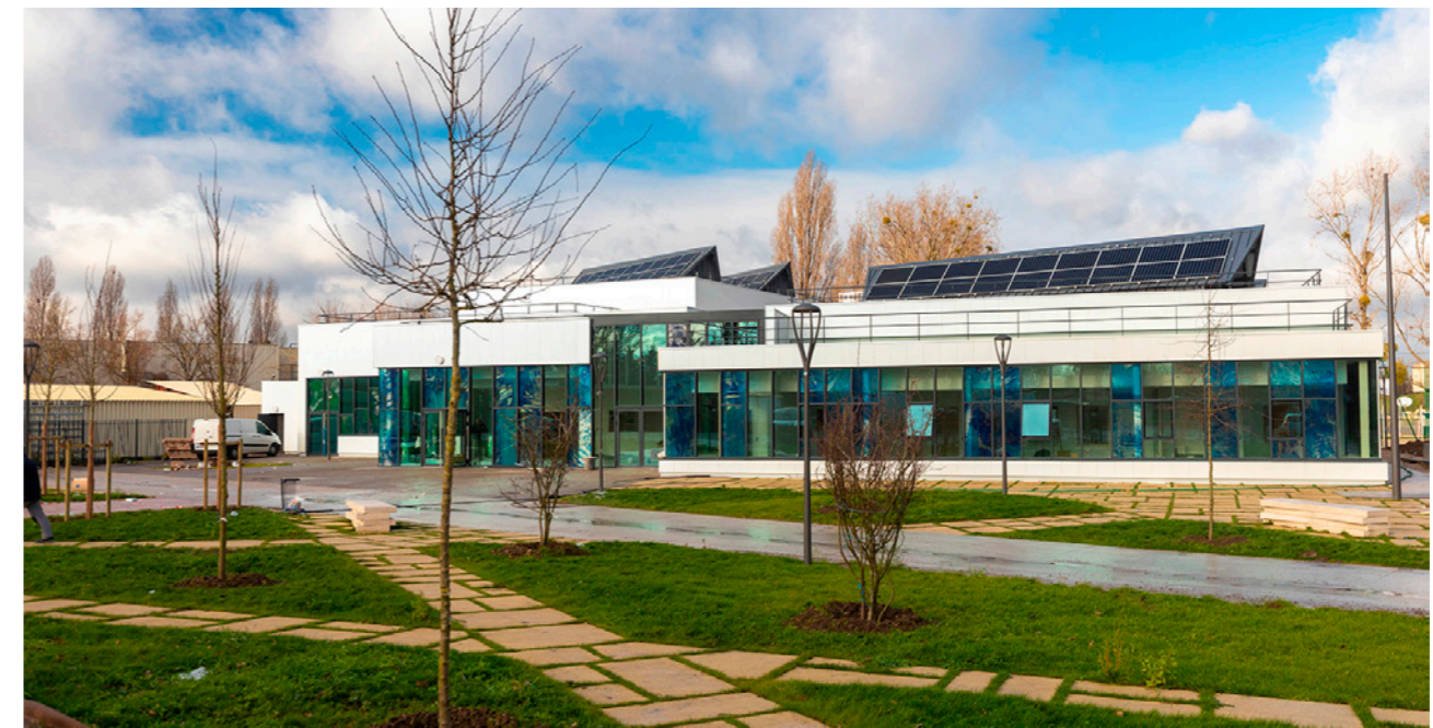
Espace Jules Verne équipement sportif et associatif

"Des aménagements intégrés au parti paysager et urbain" "Des espaces multifonctionnel pour une gestion globale des eaux pluviales"