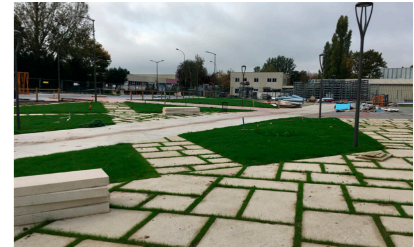
Parvis équipement sportif

"Des aménagements intégrés au parti paysager et urbain" "Des espaces multifonctionnel pour une gestion globale des eaux pluviales"