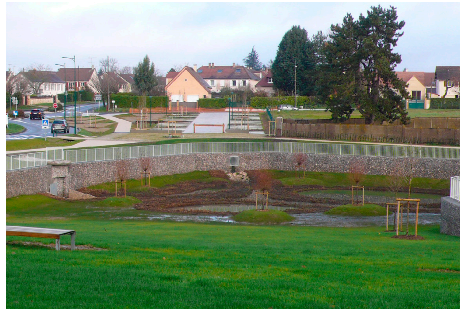
Vue depuis le bassin vers la Place du Lavoir et le parking