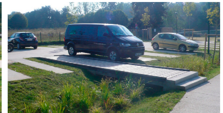
Vue sur le passage piéton