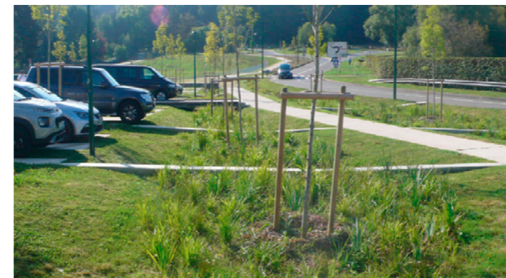
Noue pour récupération des ep du parking