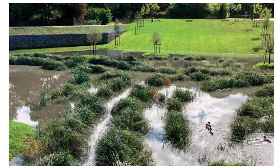
Bassins permanents détail