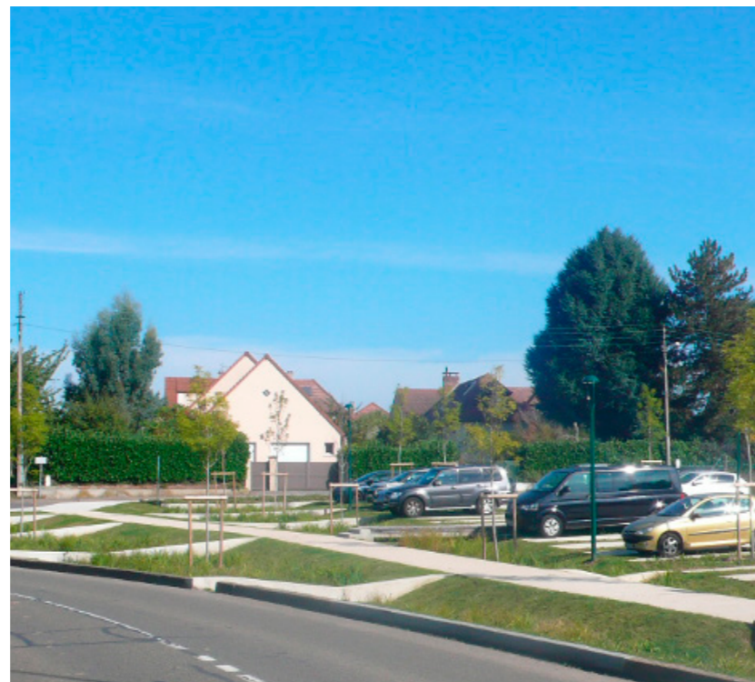
Un parking déconnecté, perméable et végétalisé