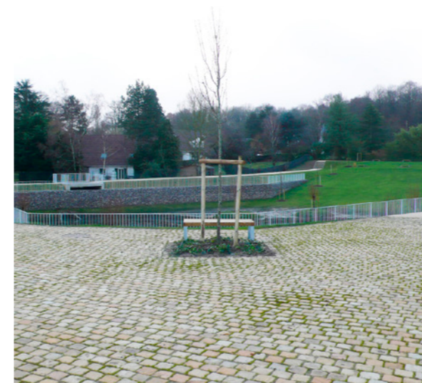
Vue depuis la Place du Lavoir