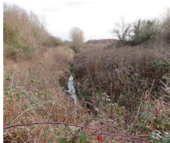
Existant Ru de la Serpentine