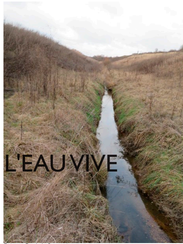
Existant Ru de la Serpentine

Le souhait est de renforcer la biodiversité en diversifiant les espaces végétalisés et en assurant des continuités vertes.