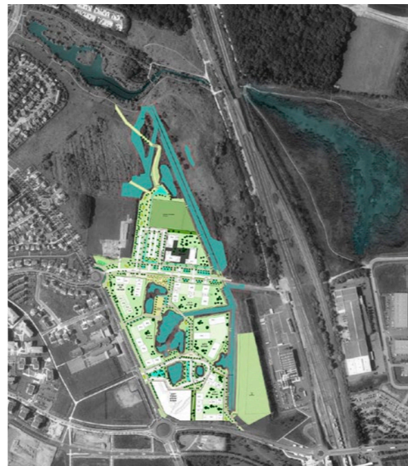
Insertion dans le site