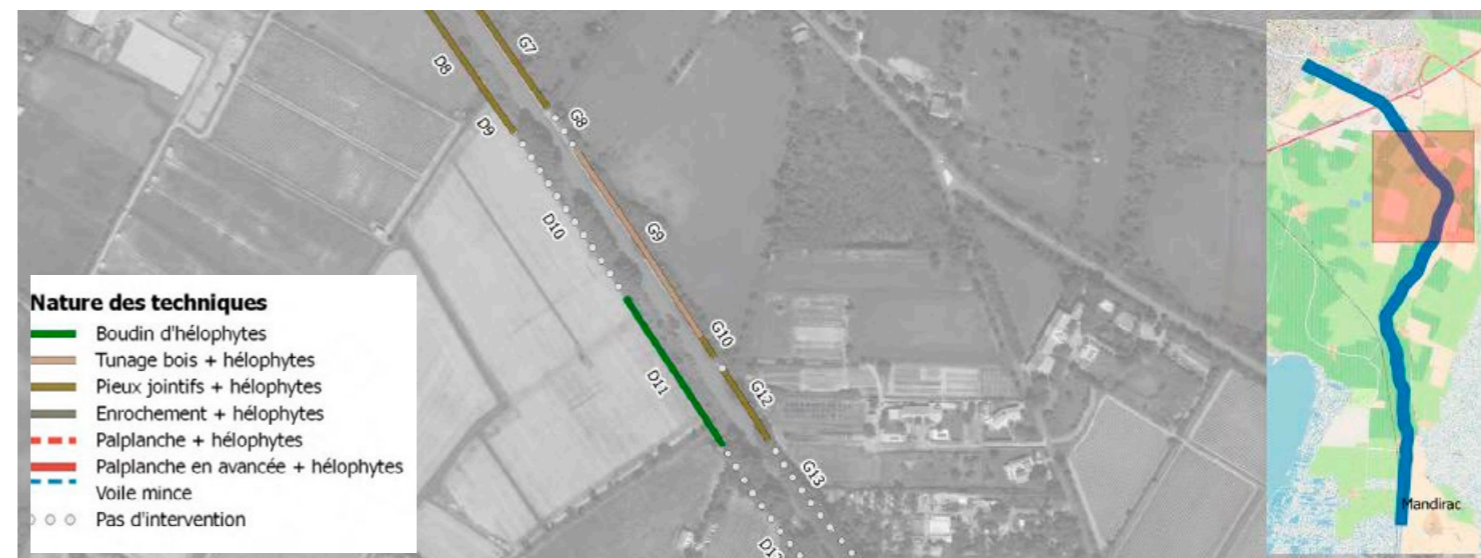
Carte diagnostic état des berges.