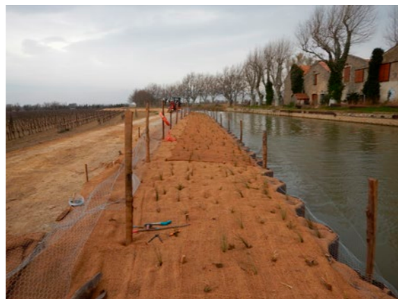
Travux en cours