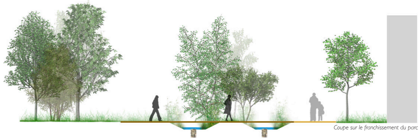
Coupe sur le franchissement du parc

"Une coulée verte centrale pour mise en scène des eaux pluviales..."