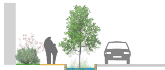
Coupe de principe trottoir / noue / voirie

"Une coulée verte centrale pour mise en scène des eaux pluviales..."