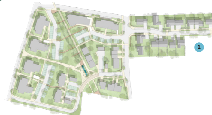
●●● Schémas de remplissage des dispositifs de stockage et seuils d'inondabilité