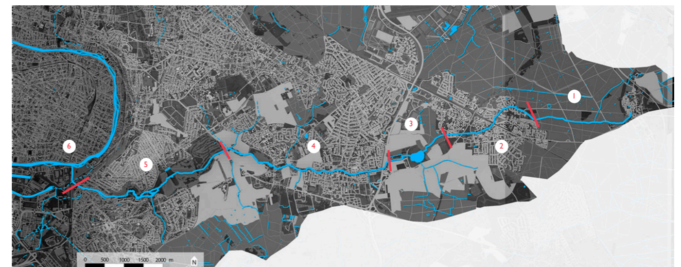
Découpage du Morbras en tronçon homogène